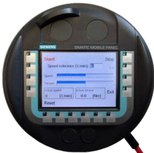
HMI für Kistler Instrumente AG

Da IBAG nicht nur die Spindel, sondern komplette Anlagen anbietet, sind massgeschneiderte Lösungen auf die individuellen Bedürfnisse unserer Kunden möglich. Sowohl Hard- als auch Software werden bei IBAG erstellt und auch entsprechend geprüft. Die Anlagen werden entweder durch eine vom Kunden übergeordnete Steuerung gesteuert, dies kann über konventionelle 24V-Schnittstelle erfolgen, als auch über Bus-System. Alternativ kann die Anlage auch über ein Bedienpanel bedient werden,