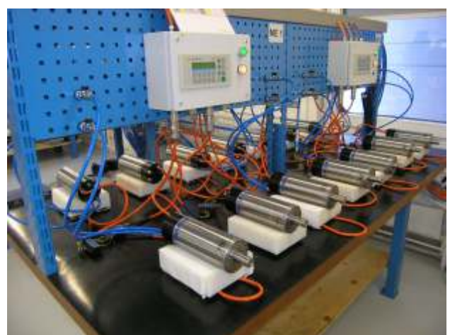
IBAG Switzerland AG, CH-8302 Kloten

Selbst bei IBAG sind Anlagen zum Testen der Spindeln im Einsatz. Auch bei diesen wurde die Soft- und Hardware bei IBAG vollumfänglich entwickelt und realisiert. Bei diesen Testeinrichtungen kann vom Bediener über ein Bedienpanel der entsprechende Motor über ein Bedienpanel angewählt, die Spindeln mit allen erforderlichen Medien individuell versorgt, und