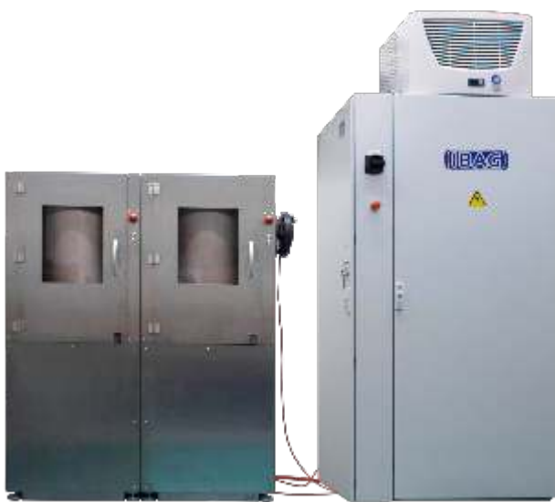
Kistler Instrumente AG, CH-8408 Winterthur

Bei einer weiteren Anwendung werden Prüflinge auf Drehzahl beschleunigt und lediglich auf mechanische Festigkeit unter Drehzahl geprüft (Berst-Tests). Diese Tests erfordern gewöhnlich spezielle Drehzahlprofile, d.h. der Prüfling wird über einen längeren Zeitraum schrittweise auf Maximaldrehzahl beschleunigt und später wieder gebremst. Auch hier bietet IBAG Komplettlösungen an.