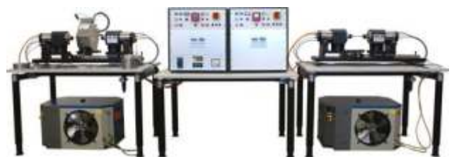
Walter + Bai AG, CH-8224 Löhningen

derselben Achse liegende Spindeln gespannt. Die eine Spindel treibt den Prüfling an, während die andere Spindel ohne Antrieb mitläuft. Die Gegenspindel ist auf einem Drehpunkt gelagert, dabei wird ein Biegemoment auf den Prüfling ausgeübt. Durch die Drehbewegung des Prüflings entsteht dadurch eine Wechselbiegespannung. Mit höheren Drehzahlen kann der Test entsprechend beschleunigt werden.