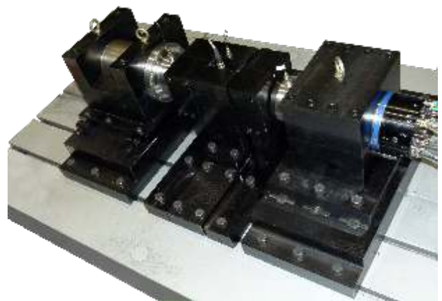
Korea Electrotechnology Resarch Institute (KERI)

Spindel an. In diesem Fall wird die Spindel in Drehmomentregelung betrieben. Über das Drehmoment wird vorgegeben, wie stark der Prüfling belastet werden soll. Die Bremsenergie wird bei mittleren und grösseren Prüfständen dann wieder ins Netz zurückgespielen. Die bezogene Leistung vom Netz reduziert sich für das gesamte System auf ein Minimum, ferner kann ein unnötiges Aufheizen der Prüfhalle vermieden werden. Die Tests werden gewöhnlich mit unterschiedlichen Drehzahlen und Belastungen durchgeführt. Die Prüfzyklen können fest in der Steuerung zur Anlage hinterlegt werden, oder durch eine übergelagerte Steuerung vorgegeben werden. Auch hier geht IBAG auf die Bedürfnisse des Kunden ein.